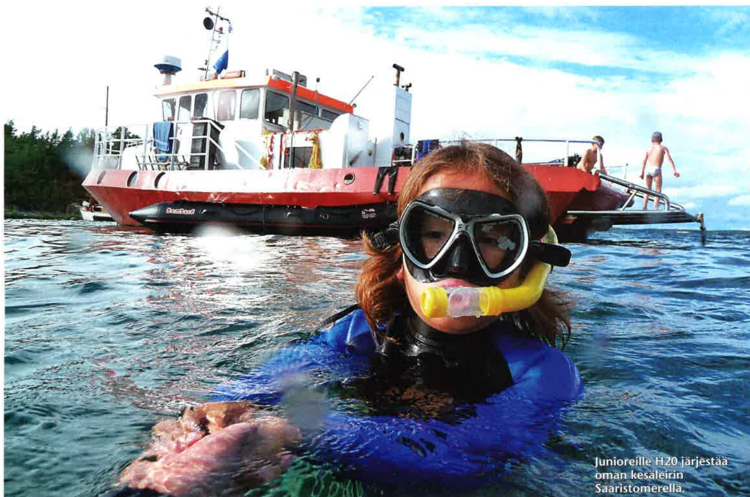
Junioreille H2O järjestää oman kesäleirin Saaristomerellä.

voimaansa. Syventäville kursseille otamme maksimissaan 8-10 koulutettavaa.